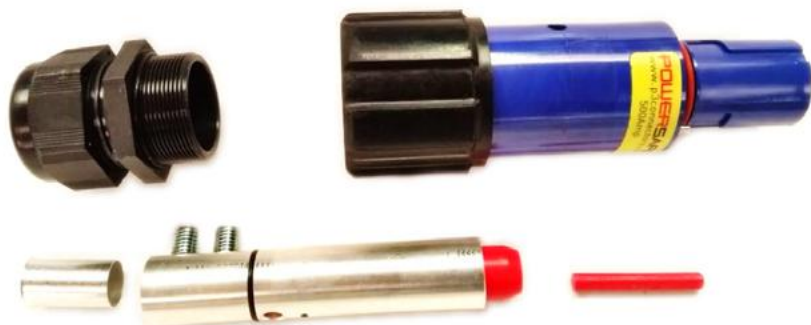
Kontaktdonets delar (Hona visas här)

Nedan beskrivs en steg för steg instruktion hur man kontakterar 500A kabeldon med skruvkontakter. (Se separat instruktion för 800A don med krimpkontakt). Det är viktigt att instruktionen noga följs för en säker anslutning.